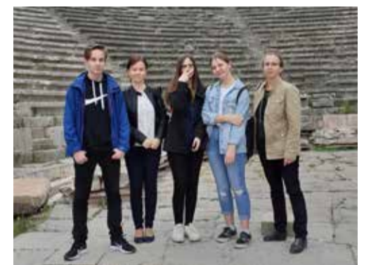
Saverna kooli esindus iidse amfiteatris.