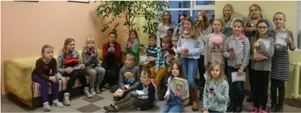
Mänguajakonkursi auhinnaüritusest osavõtjad.