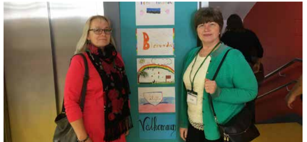
Irimaa koolis oli külaliste vastuvõtuks tehtud põhjalik ettevalmistus.