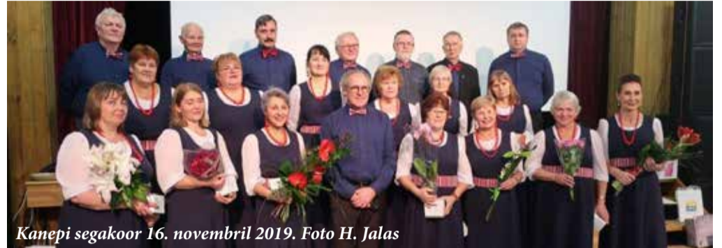
Kanepi segakoor 16. novembril 2019.

Lugupidamisega Vaike Kottisse, Kanepi segakoori president