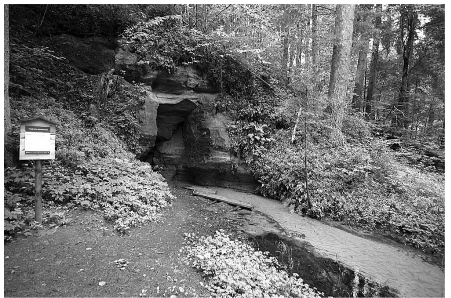
Tilleoru Merioone kivipaljand.