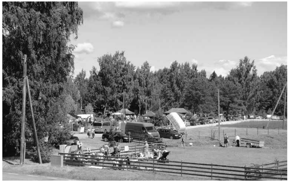
Ritsike kogukonnapäev ja laat.