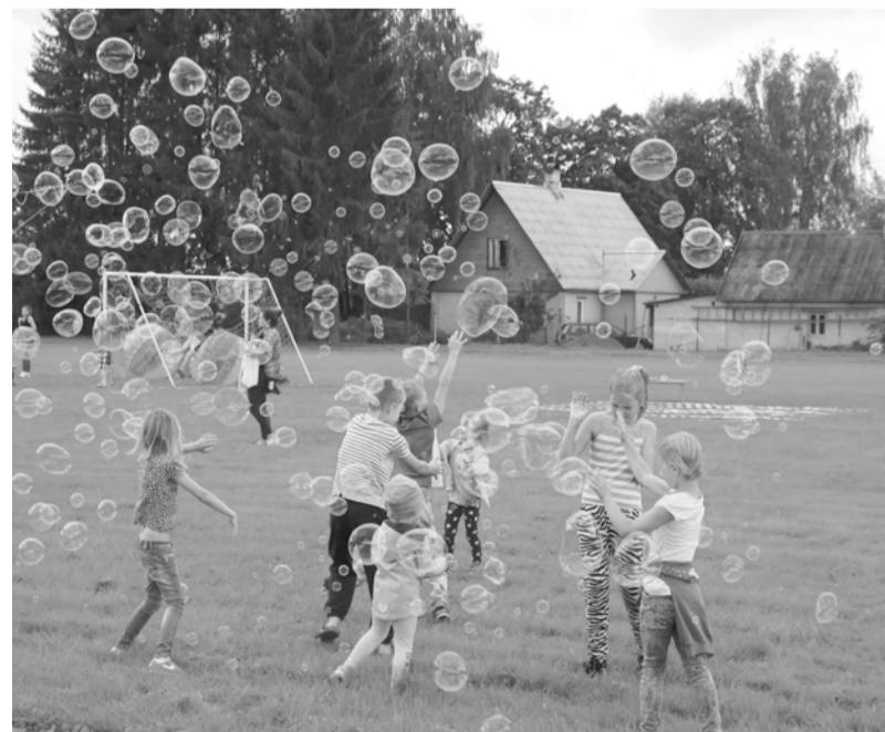
Kaheksas Kanepi valla Perepäev.