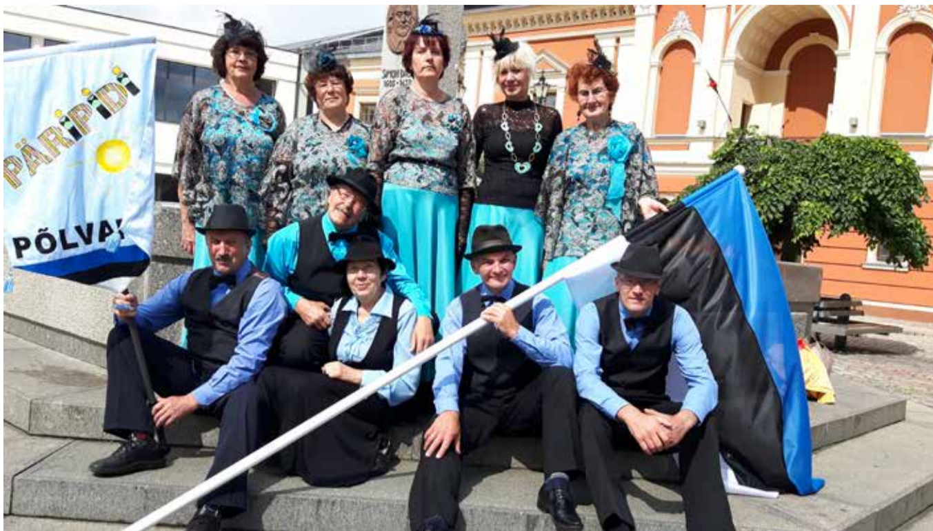
Tantsurühm Pärpide.