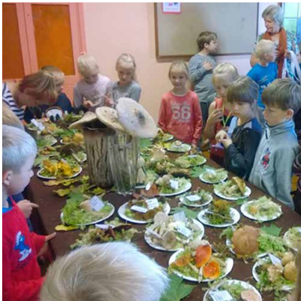
Sügisene seenenäitus Kanepi Gümnaasiumis.