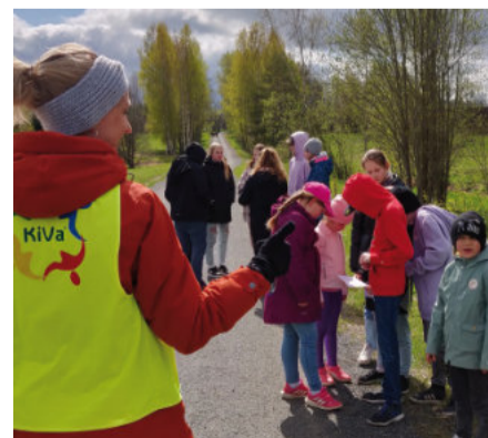
KiVa päeva maastikumäng.

Põlva maakonna ennetustööspsialist irena.viitamees@polvamaa.ee