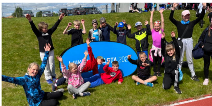
Kanepi Gümnaasiumi nooremad sportlased Tilsis.