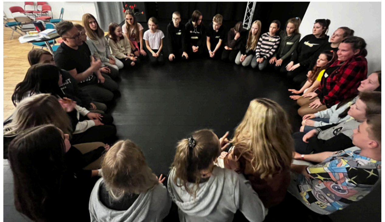
Kanepi ja Sauga valla noored Urmo töötoas.

Aprillis, kevadisel vaheajal võtsime plaani rännata teise Eesti otsa, et näha kuidas ja millistes tingimustes saab teha noorsootööd Pärnumaal, Tori vallas Sauga Mustas majas. Reisile sai kaasa tulla igast Kanepi valla otsast.