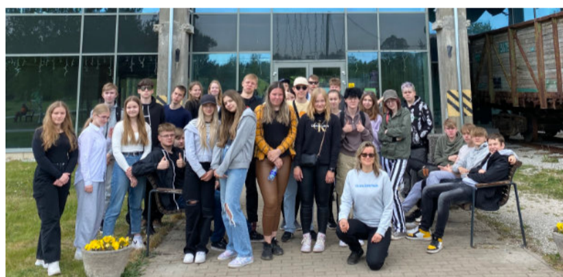
8. ja 9. klass kaevandusmuuseumis.