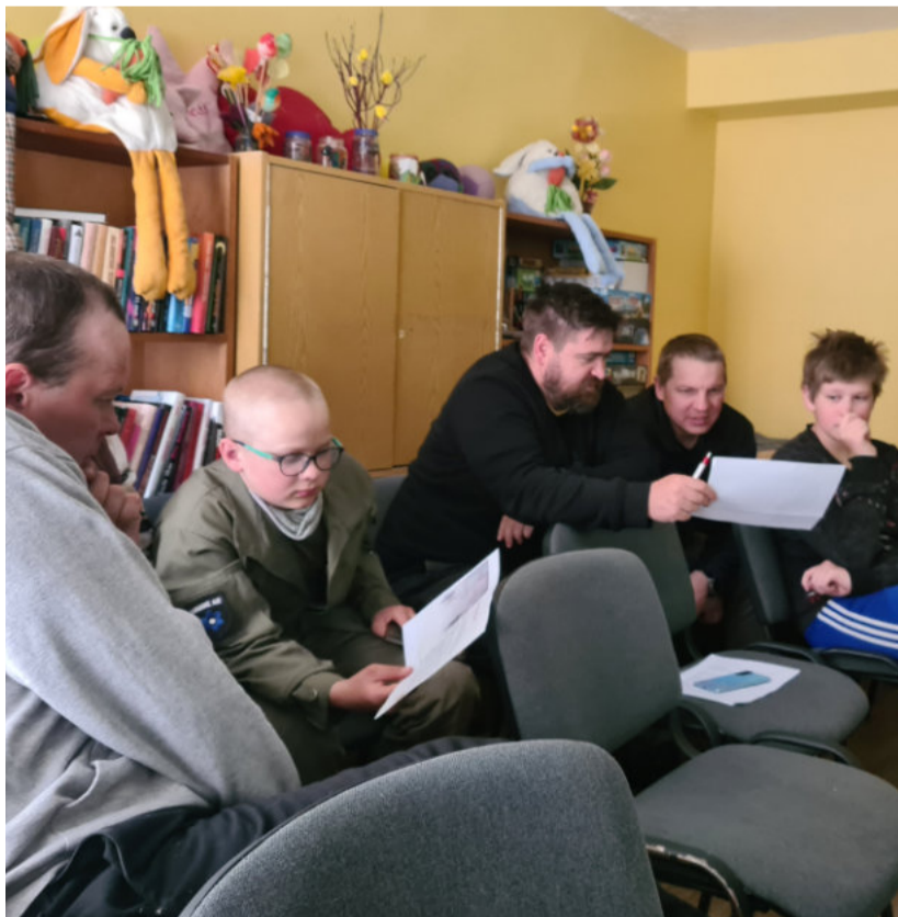
Koolitus Pranglis.