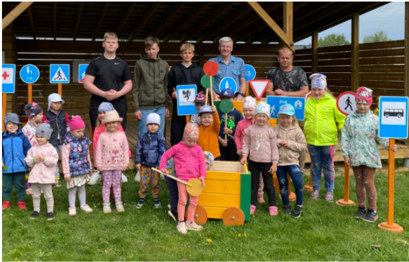
Liiklusvanker Põlgaste lasteaiale.