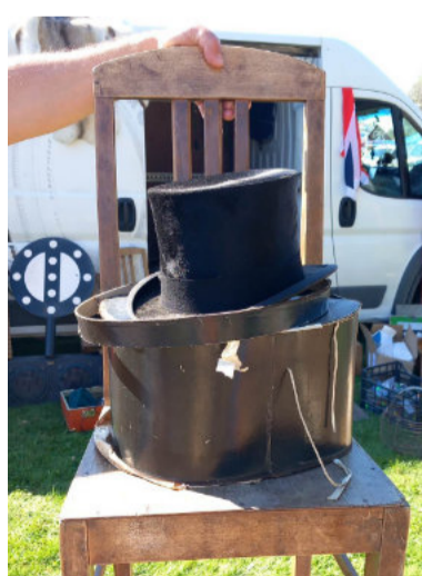
Laadaost näitekunsti harrastajale.

Traditsiooniline kevadlaat Kanepi Gümnaasiumi staadionil sai peetud 13. mail. Sel aastal oli ennast kirja pannud 115 kauplejat lähedalt ja kaugelt. Kohale jõudis neist 105. Väga paljud kaupmehed on meie kevadlaadal juba mitmendat korda ja paljud lausa esimestest