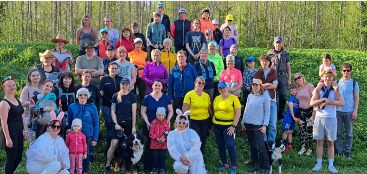
Tilleoru matkarajale minejad.

12.mail, imeilusalt reede õhtul toimus kõnnisarja "Käime läbi külade" teine etapp. Seekord tegime mõnusa jalutuskäigu Tilleoru matkarajal. Huvilisi kogunes taas üle 50-ne, enamuse neist olid juba tuttavad näod eelmise etapist.