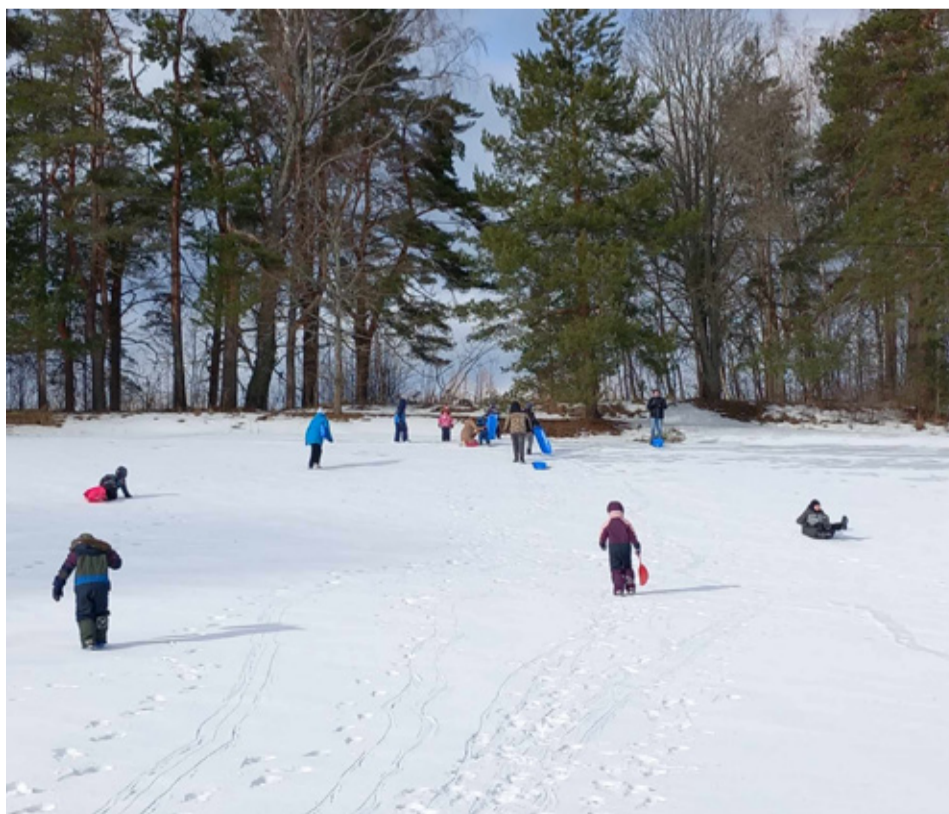
Vastlapäev Pranglis.