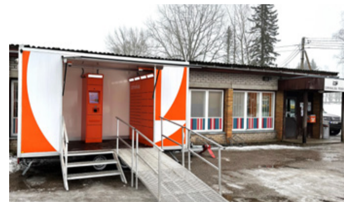
Omniva Põlgaste automaat.

Põlgaste pakiautomaadi tühendusajad: E 10.00; T-R 12.00, L 08.00