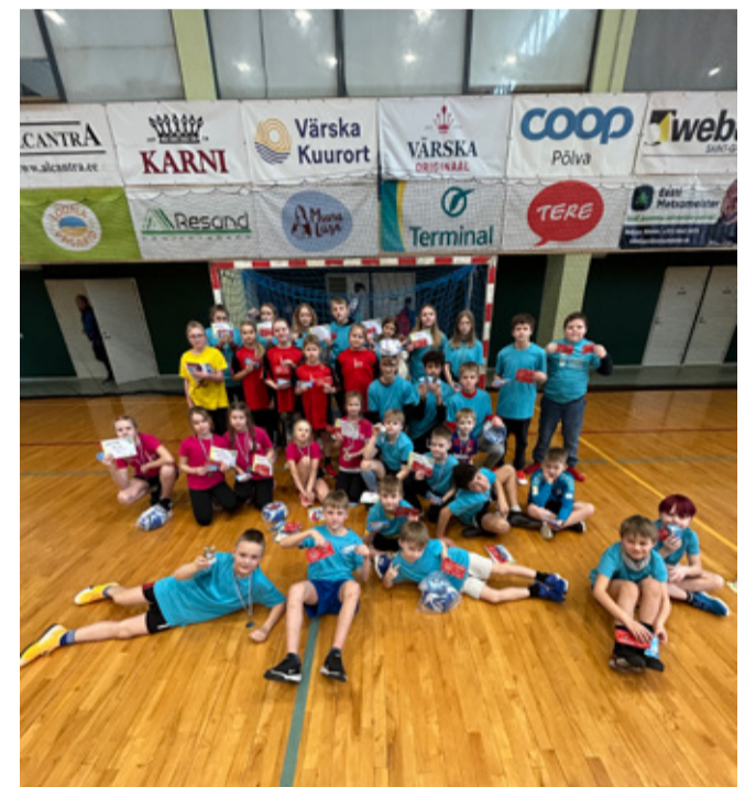
Kanepi Gümnaasiumi noored jalgpallurid.