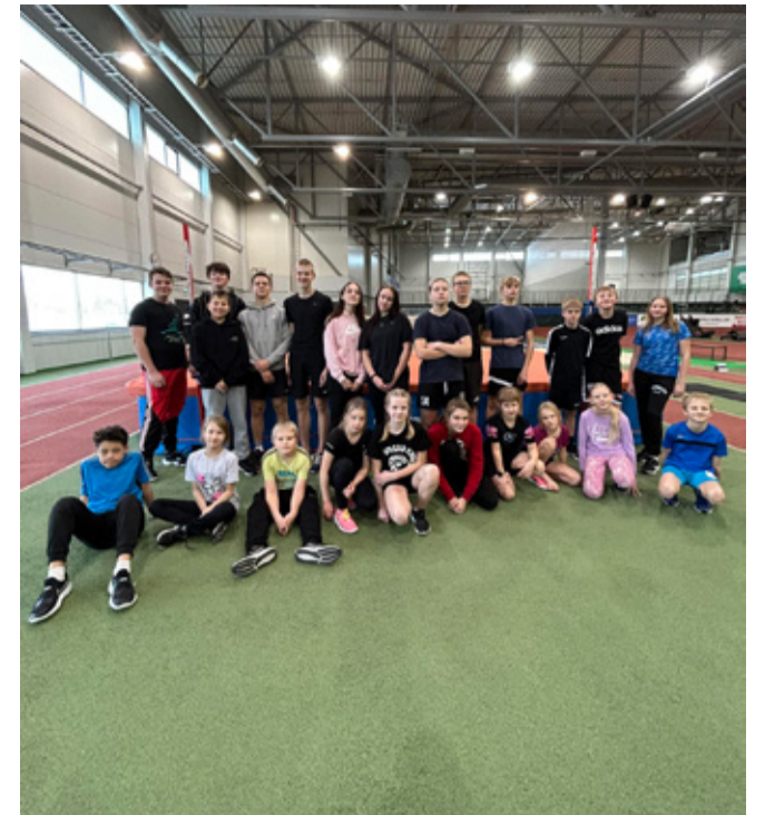
Kanepi Gümnaasiumi kergejõustiklased.