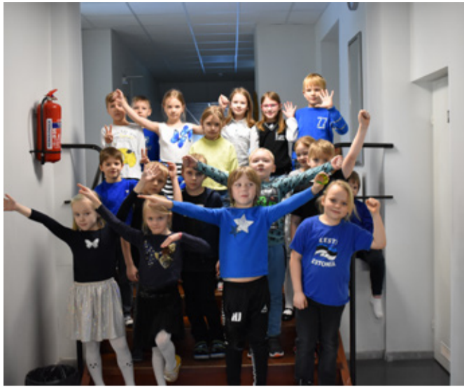
Sini-must-valge stiilipäev.