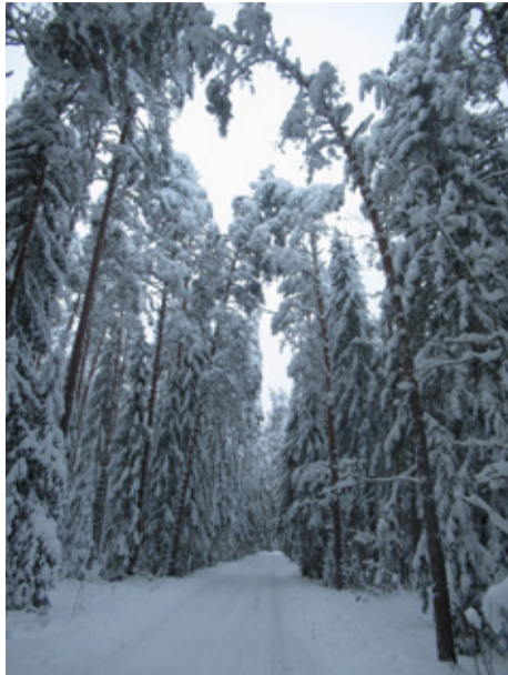
Ritsike palo.

Kaitsealal tohib korjata seeni, marju ja