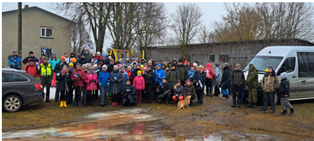
Vabariigi matk Pranglis.