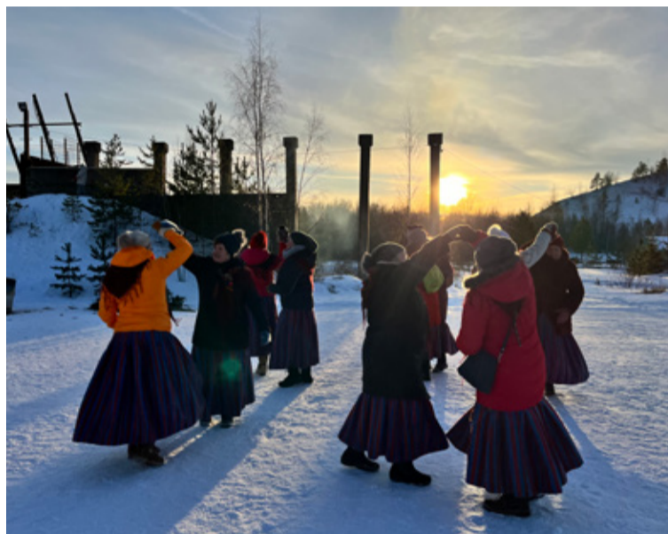
Krookus Talvepilgaril.