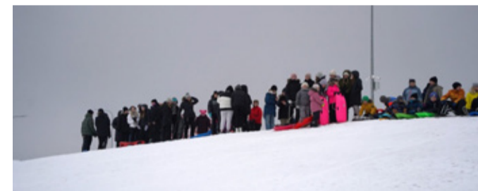
Saverna Põhikooli vastlapäev.

Vaatamata suurtele miinuskraadidele on Saverna Põhikooli koolipere tähistanud mitmeid tähtpäevi. 13. veebruaril toimunud vastlatrallil suundus kogu koolipere mäele, et liu abil linade pikkust ennustada. Trotsides külma ilma ja jäävihma, nautisid õpilased pika liu laskmist ning kelgutamisest võtsid osa ka õpetajad. Hiljem kostitati osalejaid koolimajas sooja tee ja maitsva vastlakukliga.