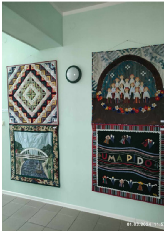
Lapivaipade näitus.

Kuni aprillikuu lõpuni saab Krootuse Külakeskuses uudistada ainulaadset lapivaipade näitust. Näitus on valminud Eesti Vabariigi 100. juubelisünnipäevaks ning kannab pealkirja „Minu Eesti täna“. Lapivaipad kujutavad endast eesti elu tegijate silmade läbi. Iga looja on näituse pealkirja tõlgendanud oma nägemuse kohaselt, kasutades erinevaid värve, mustreid, pindasid ja materjale. Autorite seas on nii kutselisi käsitöölisi, harrastusõblejaid, käsitööõpetajaid, õpilasi kui ka neid, kelle jaoks on see esimene lapitöö. Vaipad on valmistatud suuruses 1x1m ning sada vaipa annavad kokku sada meetrit kauneid pilte tekstiilis. Näitus on rännanud juba mitu aastat mööda Eestit ning lõpuks jõuab see Eesti Rahva Muuseumi, kus vaipad säilitatakse tulevaste põlvete jaoks. Näituse eestvedajad on Meremäe käsitööliselts Meroos