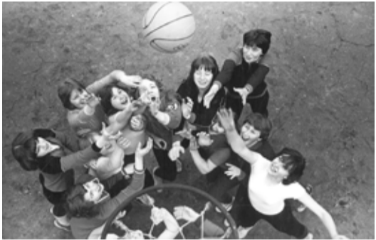
1978-1979. aasta kehaline kasvatus.