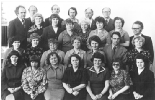
Kanepi Keskkooli õpetajad 1968. aastal.