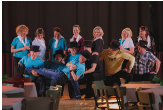
Elevus proovis.