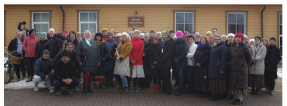
Weizenbergi tänavatuuril osalejad.