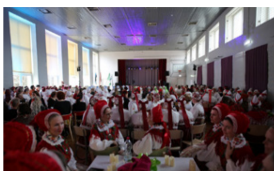
Osales ligi 300 rahvatantsijat.