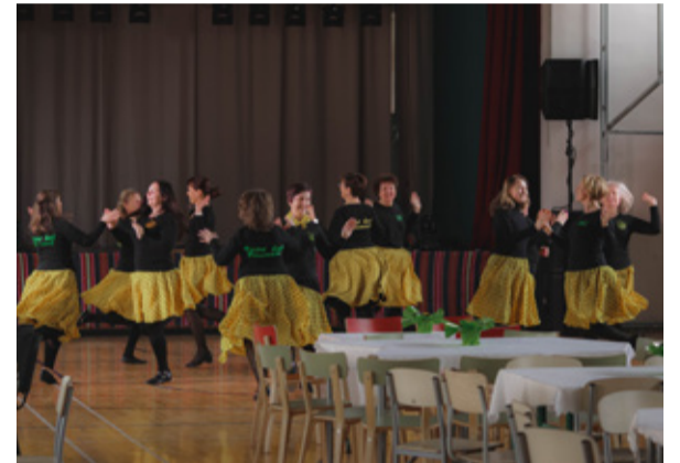
Rahvatantsijad proovis.