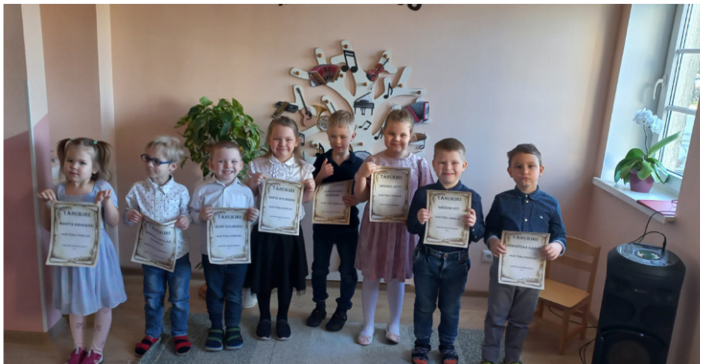
Krootuse luulekonkursil osalejad.