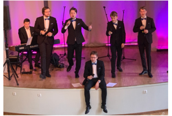
Rahvuskooper Estonia Poistekoori meeskvintett.