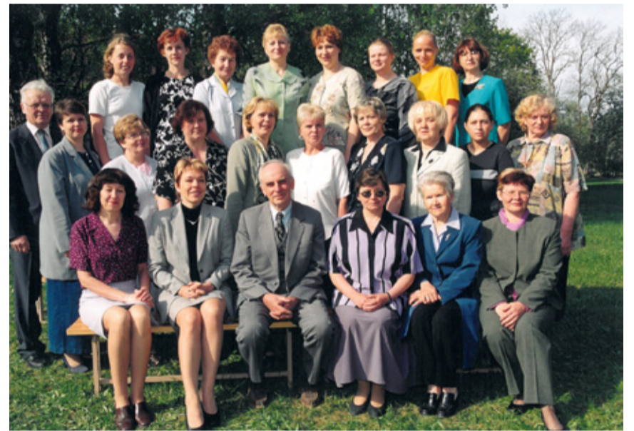
Kanepi Gümnaasiumi õpetajad 2002. aasta mais.