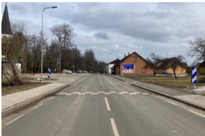
Foto 1. Künnis A. Weizenbergi tänaval

Eeltoodud A. Weizenbergi tänav näitel Kanepi alevikus on jalakäijatele teeületuseks rajatud ülekäigukohad ja sagedamini kasutatavate ülekäigukohtade vahetusse lähedusse on ehitatud künnised (Foto 1). Künniseid rajatakse teele eelkõige liikluse rahustamiseks, kuna selline füüsiline takistus sunnib sõidukijuhte kiirust vähendama.