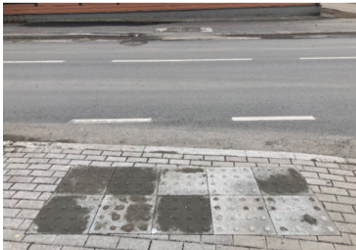
Foto 4. Ülekäigukoht.

Kanepi alevikus on ülekäigukohad rajatud jalakäijate peamiste liikumistrajektoridele, nt kaupluste vahetus läheduses. Ülekäigukohad tunneb ära madaldate künnise äärekivi ning ületuskoha alguses ja lõpus on hoiatav teekattest erinev reljeefne teekattematerjal (Foto 4). See tõmbab nii tavaliikleja kui ka nägemispuudega inimese tähelepanu sellele, et liiklemisolukord muutub.