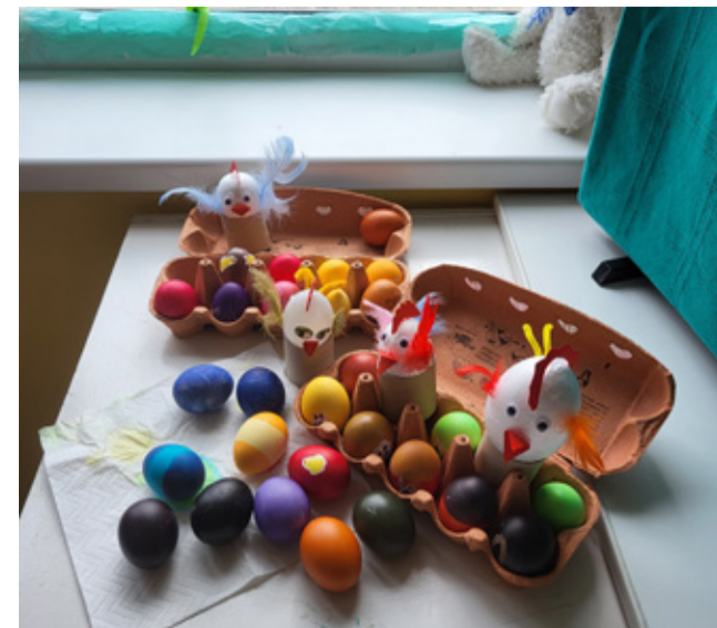
Kevadpühad Pranglis.