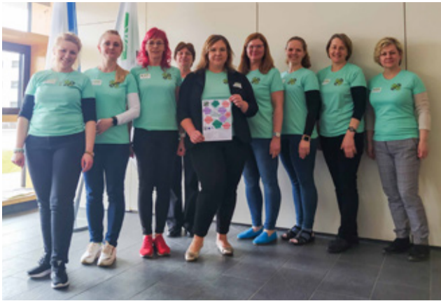
TEHA juhtrühm.