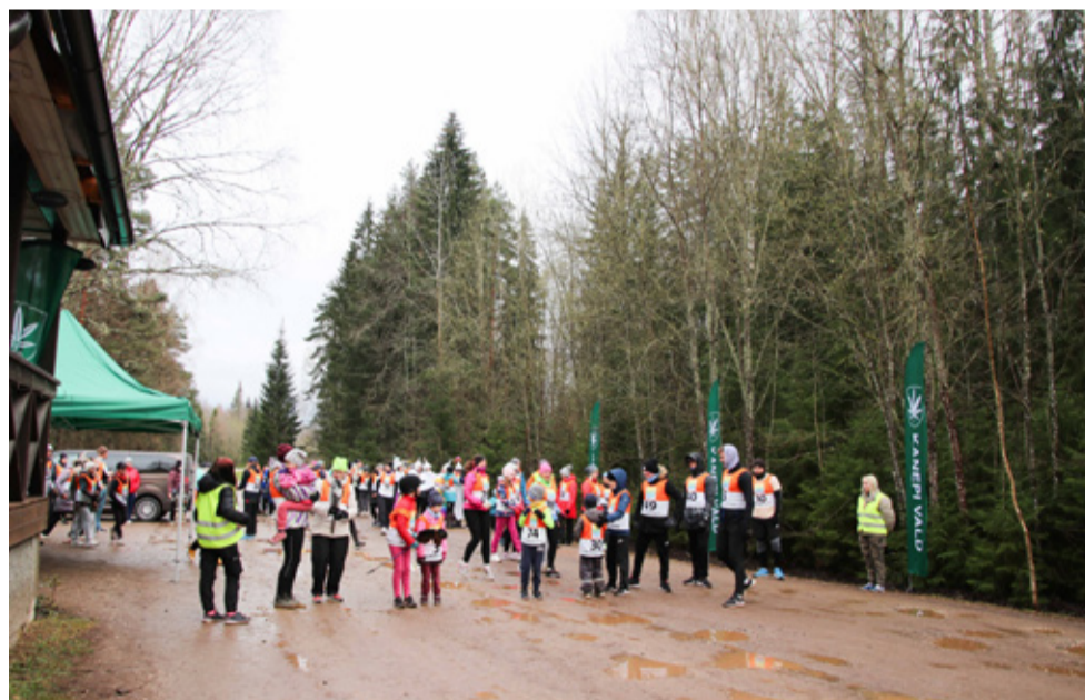
Jüriöö jooks.