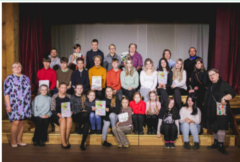
Kooliteatrite festivali ühispilet.