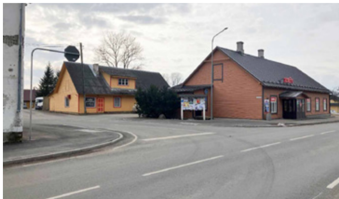
Foto 3. Ülekäigukoht Tehnika tänaval. Parem- ja vasakpöörde A. Weizenbergi tänavalt Tehnika tänavale.

Kanepi alevikus on ülekäigukohad rajatud jalakäijate peamiste liikumistrajektoridele, nt kaupluste vahetus läheduses. Ülekäigukohad tunneb ära madaldate künnise äärekivi ning ületuskoha alguses ja lõpus on hoiatav teekattest erinev reljeefne teekattematerjal (Foto 4). See tõmbab nii tavaliikleja kui ka nägemispuudega inimese tähelepanu sellele, et liiklemisolukord muutub.