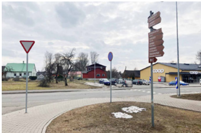
Foto 2. Parempöörde Turu tänavalt A. Weizenbergi tänavale.

Ülekäigukohas tekib teed ületaval liiklejal eesõigus vaid juhul, kui jalakäija ületab teed, millele sõidukijuht pöörab, st sõiduk sooritab vasak- või parempöörde. Kanepi alevikus on kaks sellist kohta: kui sõidukijuht sooritab Turu tänavalt tülles parempöörde A. Weizenbergi tänavale (Foto 2) või tehakse vasak- või parempöörde A. Weizenbergi tänavalt Tehnika tänavale (Foto 3). Siinkohal tuleb kindlasti rõhutada, et sellises olukorras ei tasu jalakäijal eesõigust taga ajama minna, sest pöördel on oht, et teed ületav jalakäija jääb sõiduki piilari (esimene uksepost) varju ja juht ei märka teda. Kuna jalakäija on vähemkaitsitud osapool, siis tuleb enne teeületust veenduda selle tegevuse ohutuses. Kahjuks tuleb tõdeda sedagi, et alati ei ole kõik sõidukijuhid teadlikud või unustavad oma teeandmise kohustuse.