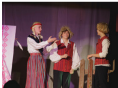
Krootuse Saaremaa onupoeg.