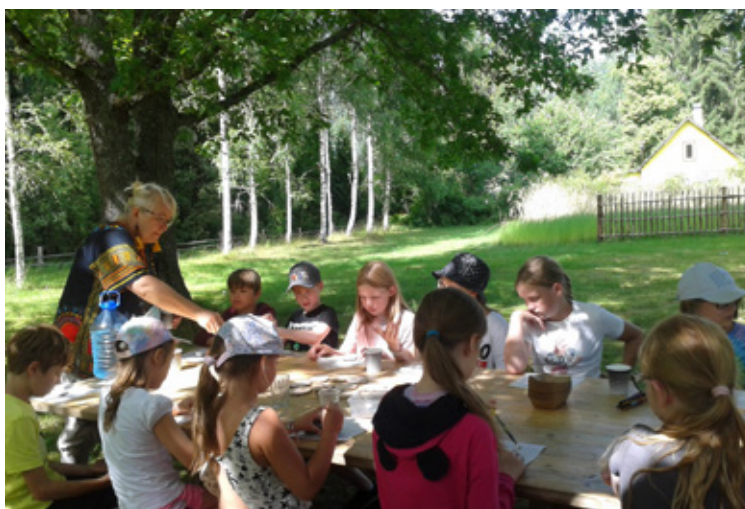
Võru keele suvelaager.

Laagrisse registreeruda ning täpsemat infot saab telefonidel 7970 310, 5801 8601 või e-aadressilt polvamaa@wi.ee.