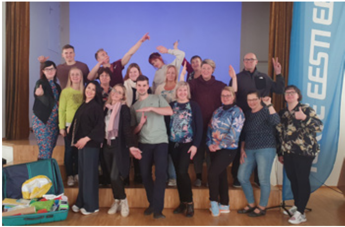
Liikumakutsuv kool Rāpina osalejad.