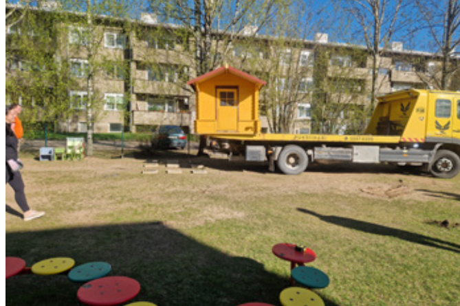
Kanepi lasteaias talgud.