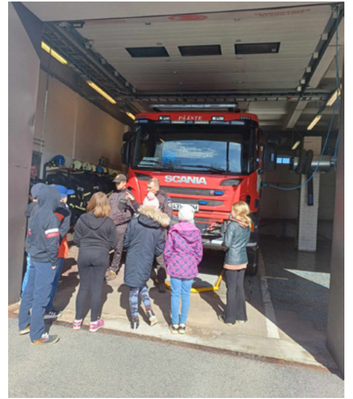
Saverna Põhikooli kolmas klass päästekomandos.